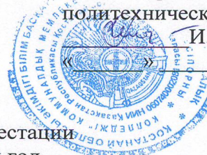
График проведения итоговой аттестации за 2019-2020 учебный год