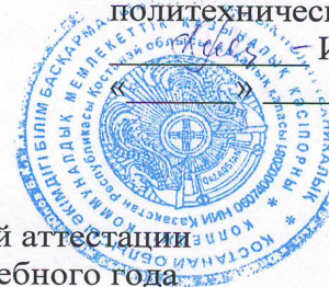
График проведения промежуточной аттестации за II семестр 2019-2020 учебного года