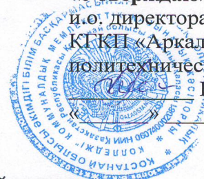
График проведения промежуточной аттестации за II семестр 2019-2020 учебного года