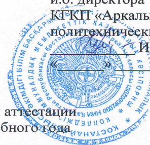
График проведения промежуточной аттестации за II семестр 2019-2020 учебного года