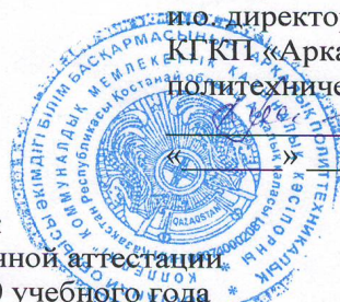
График проведения промежуточной аттестации за II семестр 2019-2020 учебного года